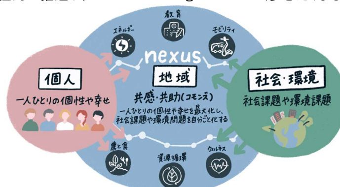
▲nexus構想が目指す姿の概念図

東急とシグマクス・ホールディングスは、今後も多様な領域のバディとの連携を拡大するとともに、各種実証実験や事業化を積極的に推進し、Walkable Neighborhood(歩きたくなるまち)の実現に邁進します。